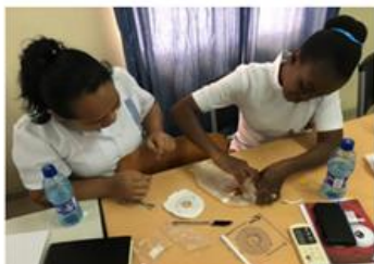
STOMAZORG | KETENZORG

Als projectondersteuner maakt u een keus aan welke van onze projecten u zich wilt verbinden en voor welk bedrag.